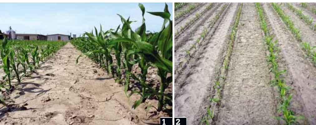
1. Effetto della concimazione localizzata fosfo-azotata (a destra ) sul vigore di partenza del mais. 2. Con primavere fresche il mais può andare incontro a una fase di crescita rallentata, che l'apporto di azoto e fosforo localizzato può migliorare

Il vantaggio in termini di anticipo dello sviluppo fenologico e del vigore colturale con la concimazione localizzata si è manifestato con diversa rilevanza in funzione della tipologia di terreno. Nei suoli più «freddi», ovvero quelli con tessitura più fine, per un maggior contenuto in argilla e limo