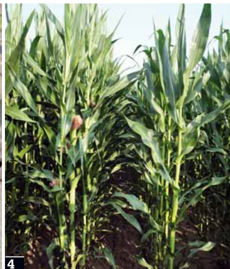
3 Sintomi di carenza di fosforo. 4 Il contributo della concimazione minerale localizzata alla semina si traduce in un anticipo della data di fioritura